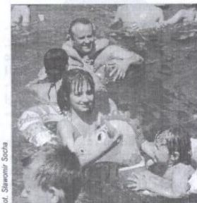
Nie ma to jak basen!

Miejski Ośrodek Kultury dopiero przymierza się do organizacji letniego wypoczynku. Akcja LATO 2002, pod hasłem „LATO ZE SZTUKĄ” rozpocznie się 19 sierpnia. Organizatorzy przewidzieli w programie: warsztaty teatralne (m.in. zabawy integracyjne, inscenizacje bajek), warsztaty wokalo-muzyczne (nauka piosenek, zabawy rytmiczne, oprawa muzyczna do spektakli), warsztaty plastyczne (budowa scenografii, wykonywanie lalek i kostiumów teatralnych) oraz biwak teatralny w Rekreacyjnym Klubie Nieprzetartego Szlaku w Skrzynicach. Zgłoszenia uczestników przyjmowane będą w dniach 1-8 sierpnia.