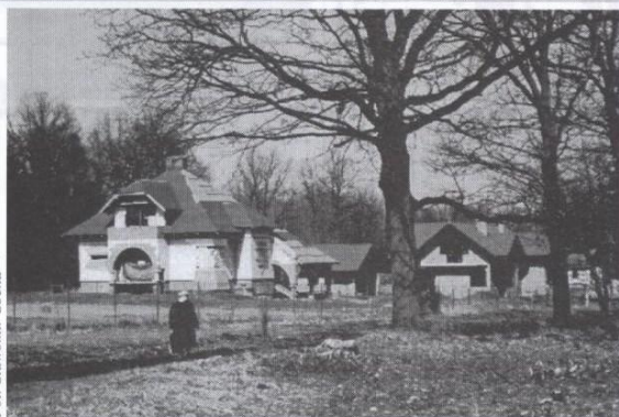
W bezpośrednim sąsiedztwie lasu stoją także okazałe budynki mieszkalne.

Obszar zieleni zaczynający się przy ul. Prostej nie jest jednolitym terenem leśnym. Znajdują się w nim starodrzewy, drogi, polany jak i działki rolne. Na ten las, zgodnie z załączeniem wojewódzkiego konserwatora przyrody, nałożono został tzw. ekologiczny system terenów chronionych, który ma być w przyszłości obszarem wyłącznie wypoczynkowym. Dotyczy to także terenów bezpośrednio sąsiadujących z lasem. Oznacza to, że wykluczone będzie tam budownictwo mieszkaniowe. Właściciele gruntów czują się tą decyzją pokrzywdzeni i rozgoryczeni. - Podjęliśmy tę decyzję bez naszej wiedzy. To był zawsze teren rolniczy i taki został zakupiony. Jest pole przy samym lesie, które zostało przekształcone na