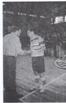
Wiceprzewodniczący ZZM wręcza Puchar i dyplom kapitanowi drużyny kupców za zajęcie II miejsca.