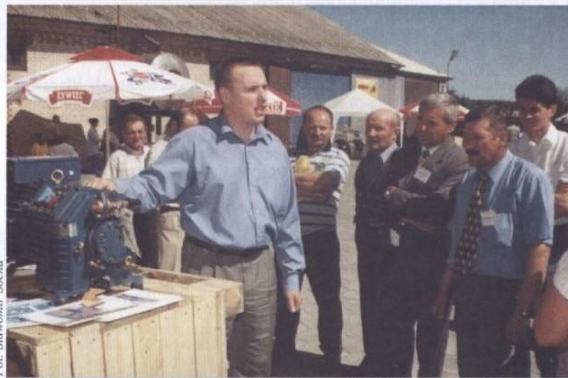
Sadownicy obejrżeli pokaz sprzętu przydatnego przy uprawie i przechowywaniu jabłek.

- Wiosnę w sadzie zaczynamy od opryskiwania przeciw chorobom - najgroźniejszą jest parch jabłoni i szkodnikom - kwaciakowi, owonicy, mszycom, owocowce. Do zbiorów opryskujemy drzewa kilkanaście razy. Wrogiem sadów są również wiosenne przymrozki. Tegoroczne spowodowały wiele strat, szczególnie w niższych położonych