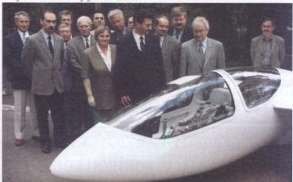
Rodzinne zdjęcie twórców PW-6