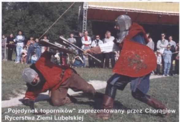
„Pojedynek toporników” zaprezentowany przez Chorągiew Rycerstwa Ziemi Lubelskiej