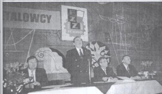
Przewodniczący Federacji „METALOWCY” chwilę po wybraniu na nową kadencję.

Materiały ZZM przygotowane przez Grupę Informacyjną Zarządu Związku. Redaktor naczelny Sławomir Prokop. Tel. 468-09-01, 751-20-61 w. 52-62.