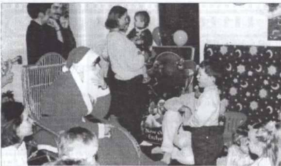
Bał mikołajkowy zorganizowany w „Klubie Twojego Dziecka” cieszył się dużą popularnością. Okazało się, że w mieście istnieje zapotrzebowanie na taką działalność.